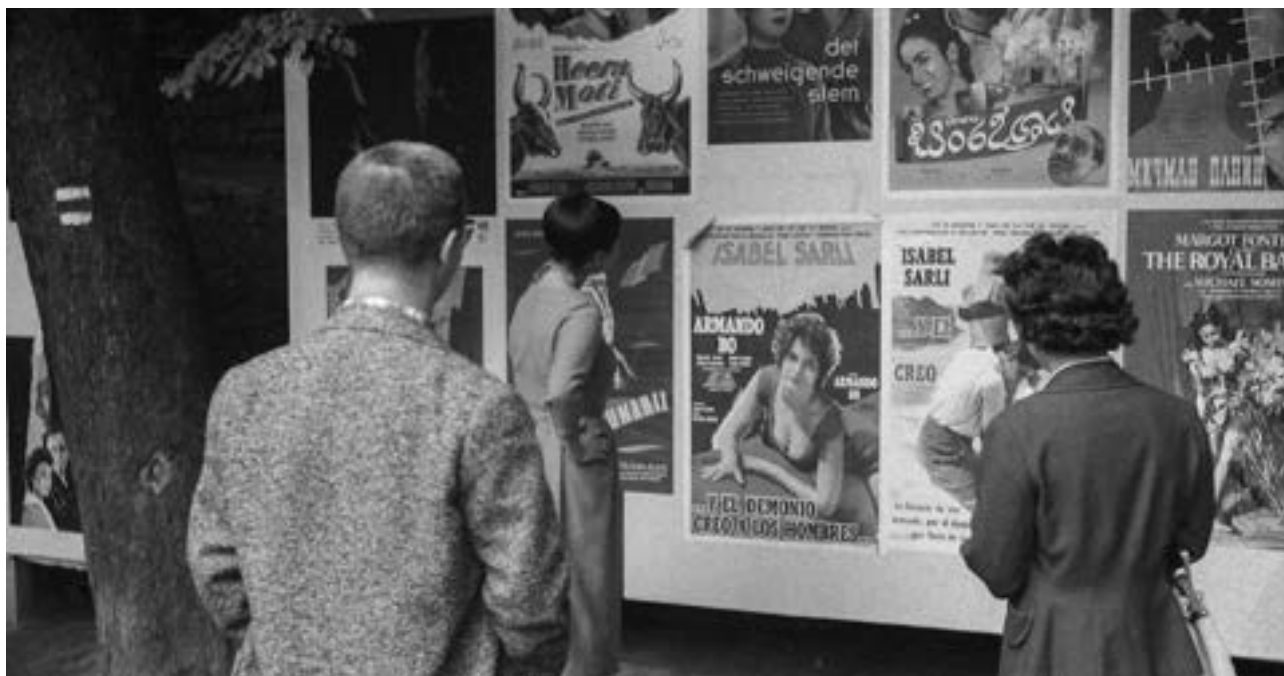
Návštěvníci festivalu, 1948,

Disproporce mezi oběma výročími byla ovlivněna několika skutečnostmi. V letech 1953 a 1955 se festival nekonal, posléze mu byla vnucena politickým rozhodnutím dvouletá periodicita. Festival, který byl mezinárodní organizací FIAPF v roce 1957 uznán jako přehlídka kategorie A (podobně jako např. festivaly v Cannes či Benátkách), se tak musel o prestižní označení podělit od roku 1959 s nově vzniklým filmovým festivalem v Moskvě.