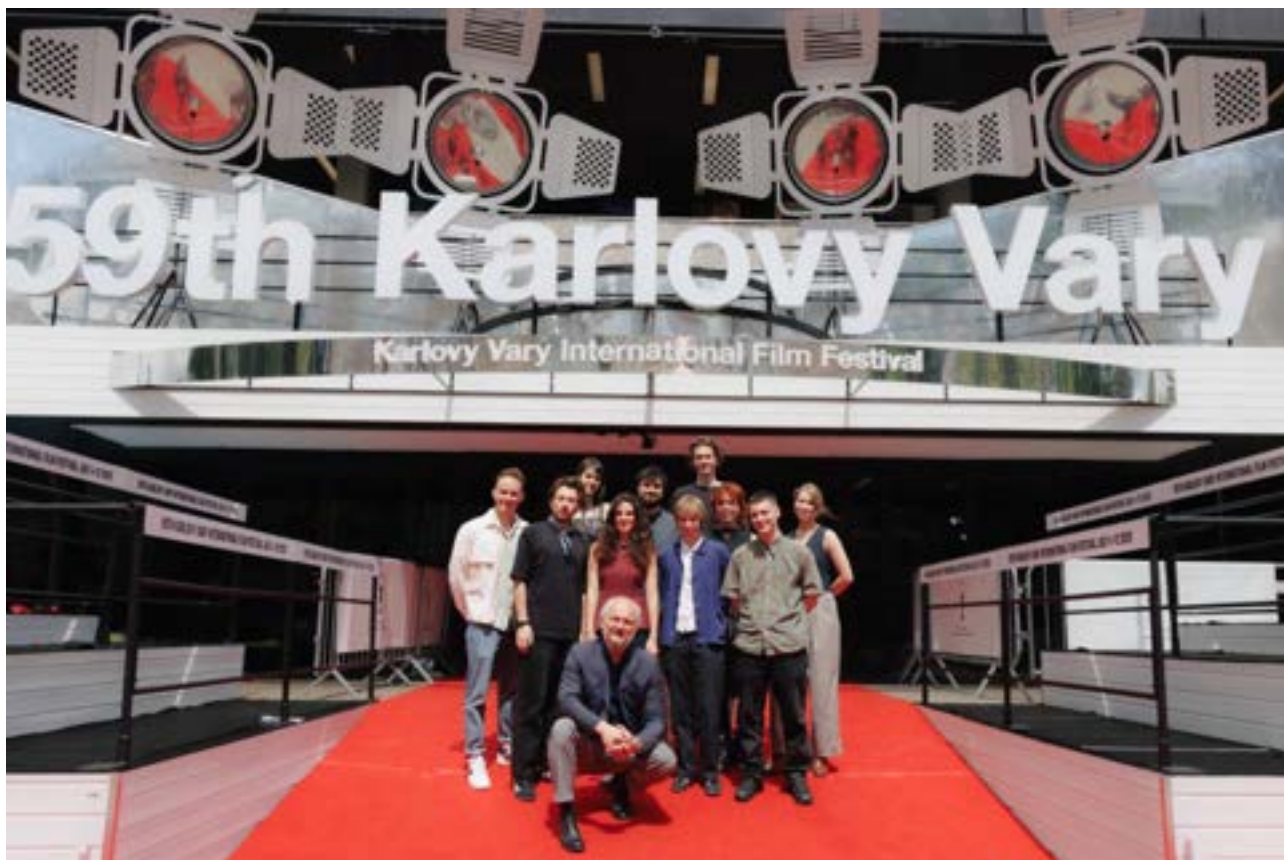
Ložští účastníci Future Frames

Program Future Frames – Generation NEXT of European Cinema, organizovaný MFF Karlovy Vary a European Film Promotion, již od roku 2015 pomáhá talentovaným evropským režisérům nastartovat jejich kariéru ve filmovém průmyslu. Již čtvrtým rokem program rozšiřuje své příležitosti díky partnerství se společností Allwyn, zaměřenou na loterie a zábavu, a díky spolupráci s americkou talentovou agenturou UTA a společností Range Media Partners, které mladým filmařům poskytují cenné odborné vedení a možnost navázat klíčové kontakty.