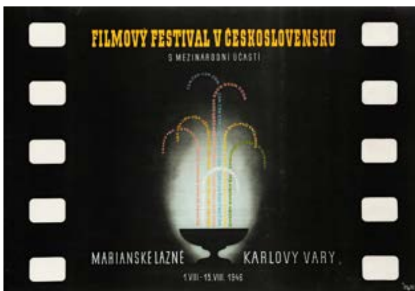
Plakát prvního ročníku festivalu, 1946