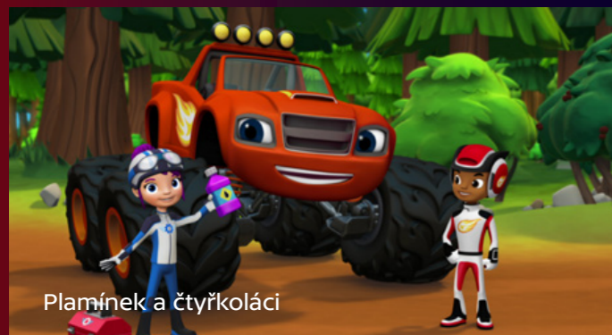
Plamínek a čtyřkoláci