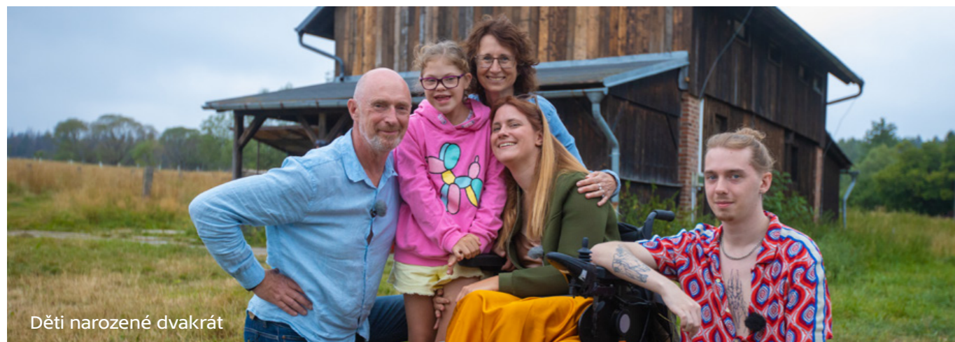
Děti narozené dvakrát