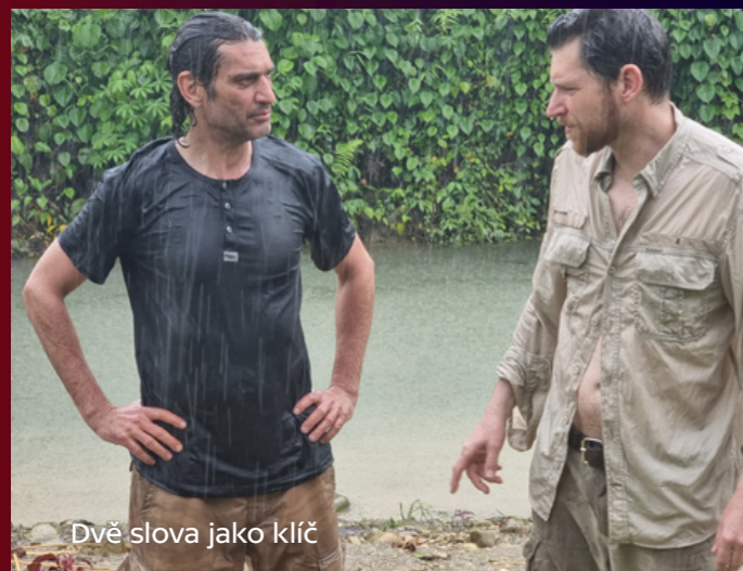
Dvě slova jako klíč

producent: Film Kolektiv kreativní producentka: Helena Uldrichová